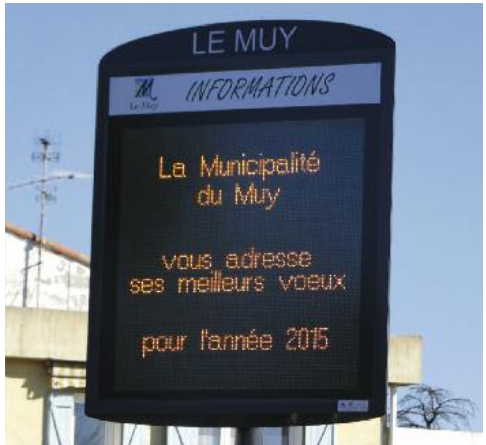
Nouveaux panneaux d'information municipale 2 nouveaux grands panneaux d'information municipale remplacent les deux petits déjà existants. Les petits seront remplacés, un sur la façade de la Mairie, l'autre sur le parc de stationnement du Roucas... Le parc de panneaux d'information municipale comprendra désormais 5 mobiliers urbains judicieusement positionnés en ville pour améliorer votre information.