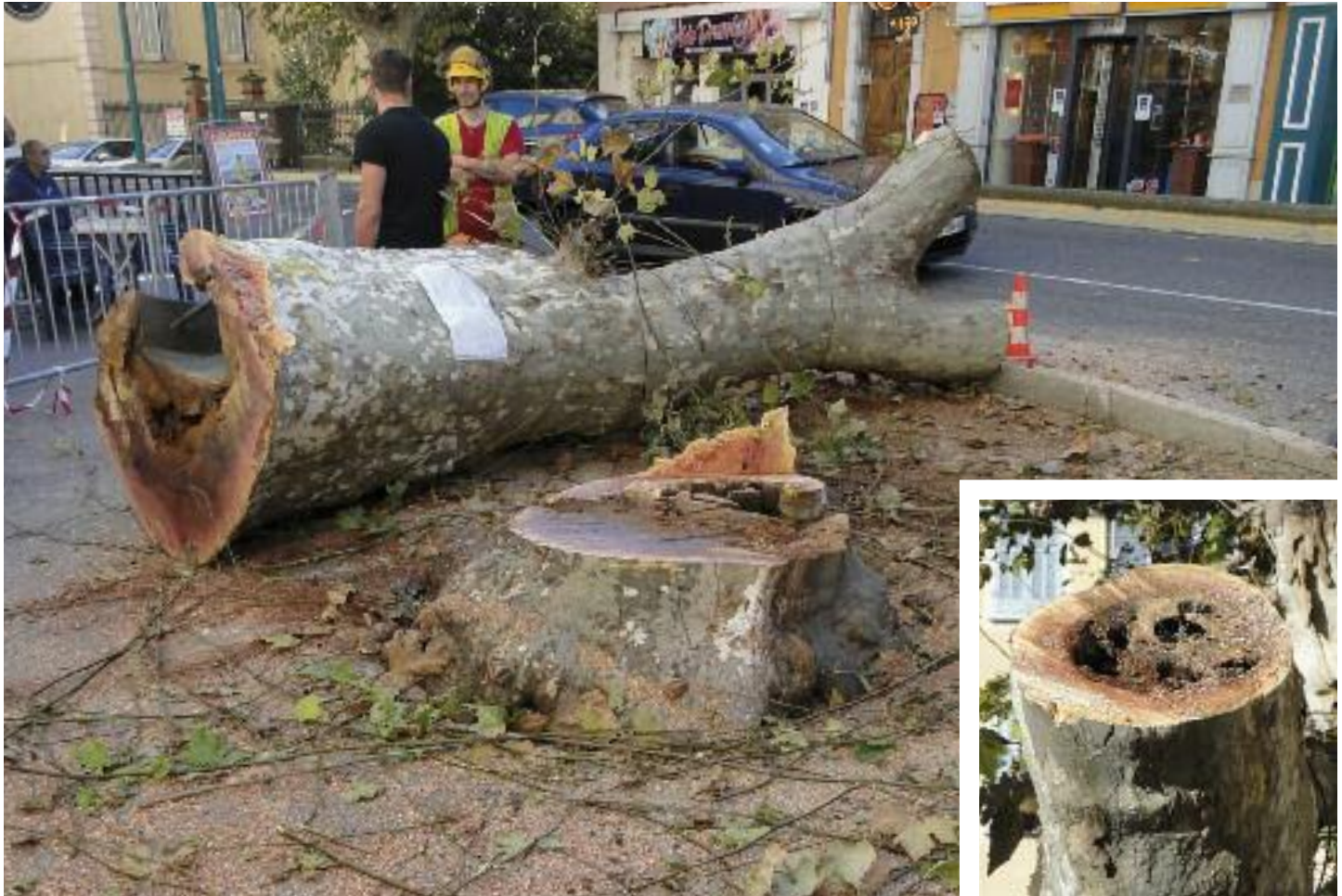
La maladie des platanes a obligé la compagnie des forestiers à abattre deux arbres et à élaguer les autres. Les arbres coupés seront bien évidemment remplacés.