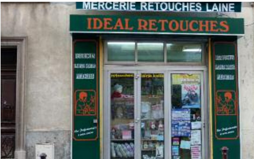
La Mercerie Idéal Retouche, 7 route de la Bourgade, a refait la devanture de son magasin lui donnant ainsi un coup de jeune.

La Société Générale du Muy fait peau neuve ! Après quelques mois de travaux, la banque située au quartier Bonnefont dévoile une façade toute neuve aux couleurs douces et actuelles. Un grand visuel quant à lui, met en valeur le distributeur automatique. Outre l'aspect extérieur, la banque a également repensé tout l'agencement intérieur pour une meilleure ergonomie. La banque, participe ainsi à la dynamisation de ce centre muyois très fréquenté, en proposant à sa clientèle un lieu toujours plus agréable pour les accueillir.