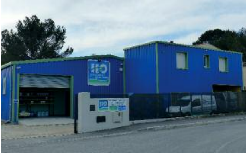
H2O piscines et spas Spécialiste du matériel de piscines et pièces détachées. 30, traverse des Ferrières ZAC des Ferrières Tel : 04.98.12.02.59